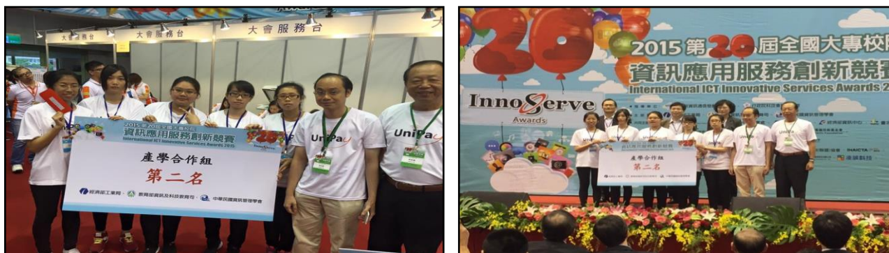
圖 2-1 學生參與相關競賽照片(2015 資訊應用服務創新競賽)

本系持續宣導並積極鼓勵日夜間部各學制的學生，能夠多多參與全國資訊服務創新競賽、大專校院資管專題競賽、全國華陀盃網路技能競賽、行政院金盾盃資安競賽、教育部程式設計競賽等全國性資訊專業競賽活動。藉由參與競賽的過程與歷練，驗證平日所學與提昇實務方面的應用能力。本系學生參與相關競賽如圖 2-1 所示。