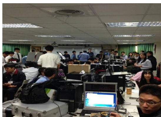
圖 2-2 學生參與相關競賽照片(2015 智慧終端與人機互動軟體創作專題競賽)